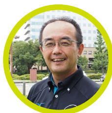
日野 稔邦 氏

2008年女子100m背泳ぎで日本記録樹立。2008北京オリンピックは背泳ぎの代表、2012ロンドンオリンピックは自由形で出場。2012年に岐阜国体を最後に現役引退。その後、スポーツマネジメント・スポーツ心理学で博士号取得。現役時代からセカンドキャリアを重要視しており、現在アスリートキャリアなどで講演を行う。生理とスポーツの教育・情報発信を行う「スポーツを止めるな」の1252プロジェクトのリーダーとしても活動中。